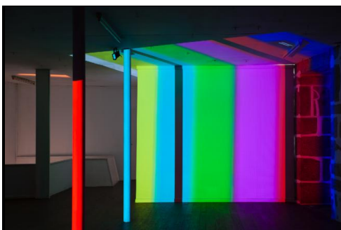
Laboratório das Artes - Edifício Milenário